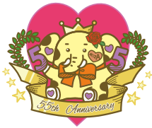
新座市イメージキャラクター ゾウキリン