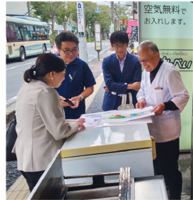
▲栄四丁目商店会でのテストマーケティング打合せ

売上げが落ち、営業が苦手なで悩んでおりました。そこで商工会に相談させていただいたところ、市内の商店会におけるシャッター看板のテストマーケティングや、戸田市の事業所様との事業マッチングをご支援していただくなど、自分1人ではできなかったことをお手伝いいただき、とても感謝しています。今後も継続してご支援をお願いしたいと思っています。